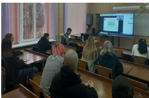
ученики СШ № 14 г. Смоленска 26.11.2021г.(вебинар)

Среди участников распространялись информационно-справочные материалы в виде памяток в количестве 126 шт.